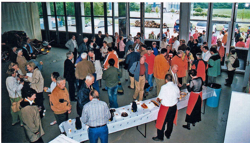
Apéro im Werkhof