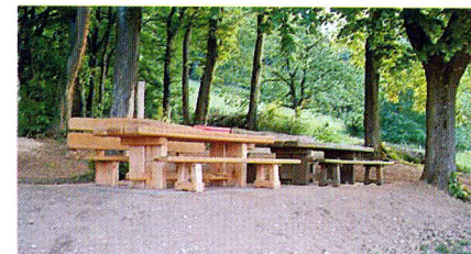
Neue Tischgarnitur auf dem Friedensplatz

Am Novartis-Partnerschaftstag, 26. April, wurde durch die Mitarbeiterinnen und Mitarbeiter der Friedensplatz mit einer neuen Tischgarnitur und einer neuen Grillstelle ausgestattet. Am Samstag, 2. Juni, fand die Jubilä-