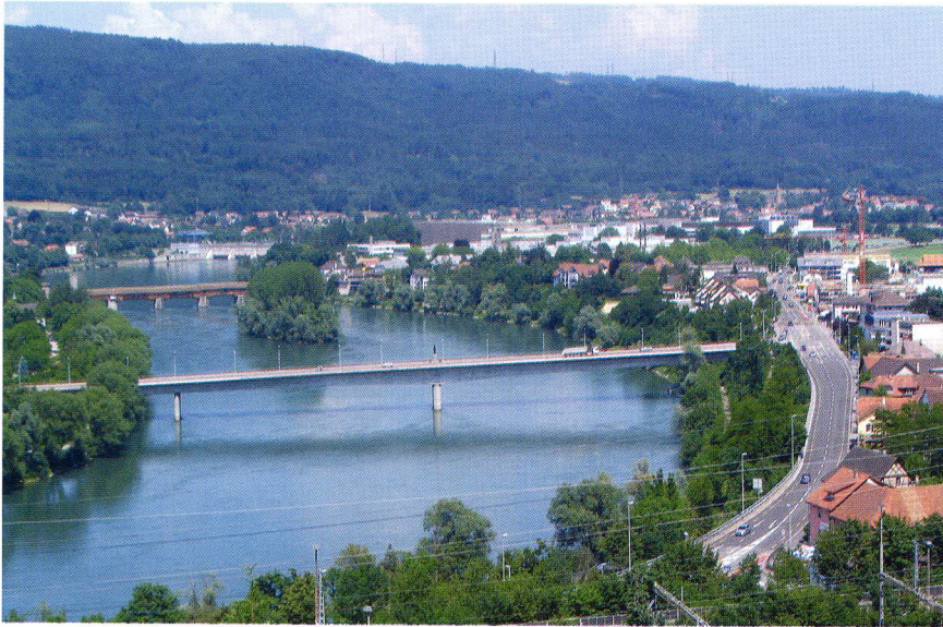
Aussicht vom Friedensplatz auf die Rheinbrücken

Vandalismus: Die Ruhebänke an der Rheinpromenade und beim Bustelbach wurden mit violetter Farbe verschmiert. Die Täter konnten nicht ermittelt werden.