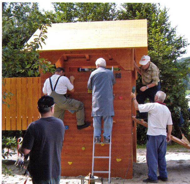
Arbeitseinsatz im Park 91