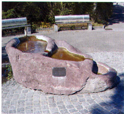
Brunnen an der Schulstrasse

Zugunglück: Am Bahnhof Stein brach am 4. Januar ein Grossbrand aus. Die SBB spendete der Gemeinde für das vorbildliche Verhalten während des Zugunglücks einen Brunnen. Standort an der Schulstrasse/Coop-Parkplatz. Der Brunnen hat drei verschiedene Becken aus einem Verrucano-Stein (Findling aus Steinhausen ZG). Kosten ca. 8000 Franken. Dazu wurden vier Bänke aus rostfreiem Stahl gesetzt. Die Einweihung erfolgte am 31. Januar.