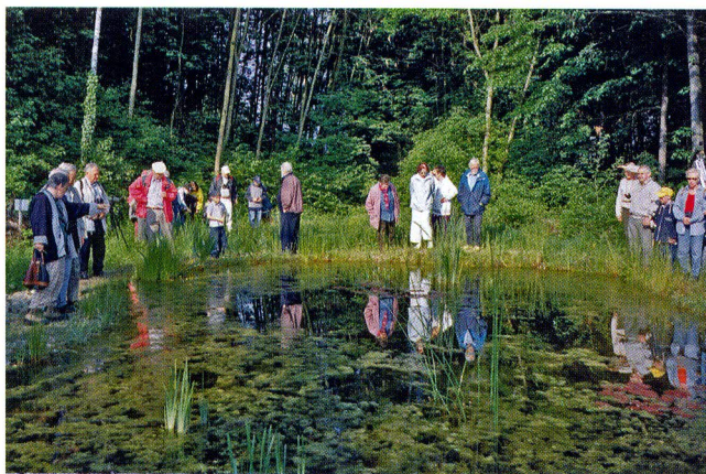
Einweihung Biotop Kraftwerk

Einweihung Biotop Kraftwerk: Bei schlechtem Wetter erfolgte die Einweihung am 5. Mai. Der erste Teil wurde beim Biotop abgehalten. Für den zweiten Teil zügelten wir in den Werkhof. Eine stattliche Anzahl von 58 Personen nahm an den Feierlichkeiten teil, u.a. der technische Direktor des Kraftwerks Stein-Bad Säckingen sowie der Gemeinderat Stein. Wir haben für dieses Biotop über 600 Arbeitsstunden geleistet. Die Gesamtkosten betragen Fr. 29'489.80. Vandalismus auf dem Vitaparcours: Fünf angeheiterte Burschen demolierten auf ihrem Heimweg die Beleuchtungsmasten und einige Infotafeln am Fischingerweg. Die Täterschaft wurde ausfindig gemacht. Vitaparcours: Der Zivilschutz hatte an-