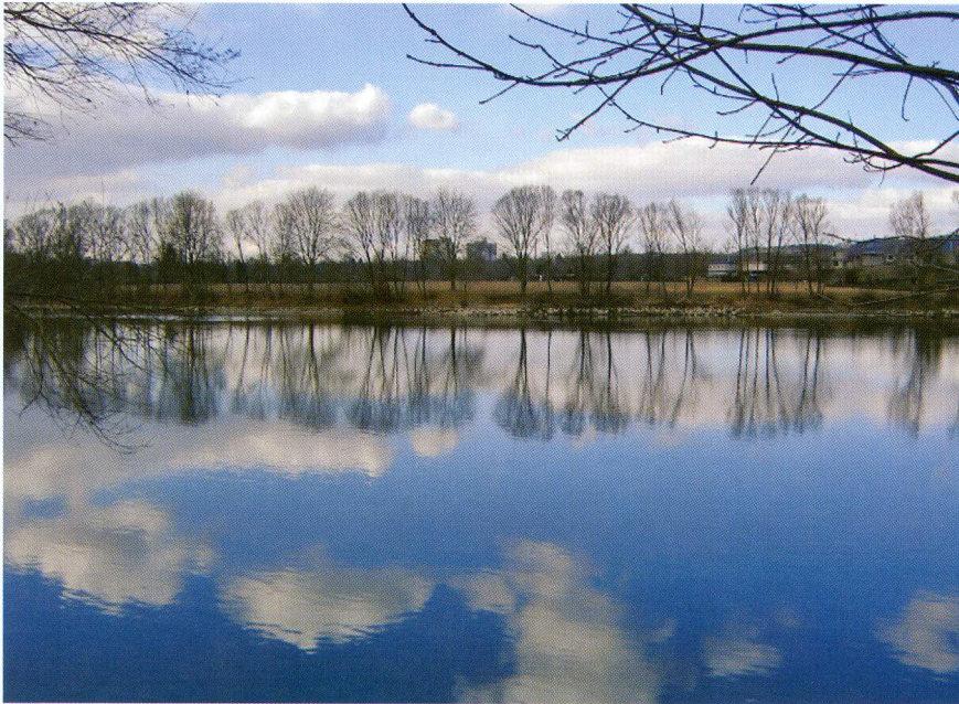
Spaziergang am Rhein