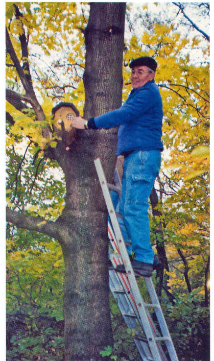
Aus der Vogelperspektive