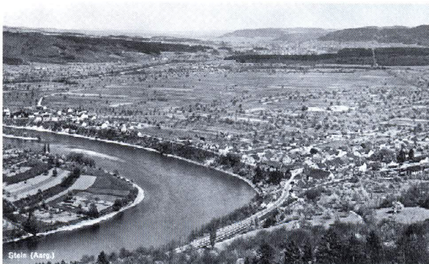
Sisslerfeld um 1950

1934 hatten einige Initianten die Idee, am Rhein einen Badeplatz zu bauen. Da aber die geologischen Gegebenheiten bescheiden waren, blieb es bei einem Minstrand bei der sogenannten Pegelmauer, in der Nähe der heutigen Fridolinsbrücke.