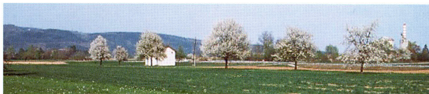
Grundwasserpumpwerk um 1982